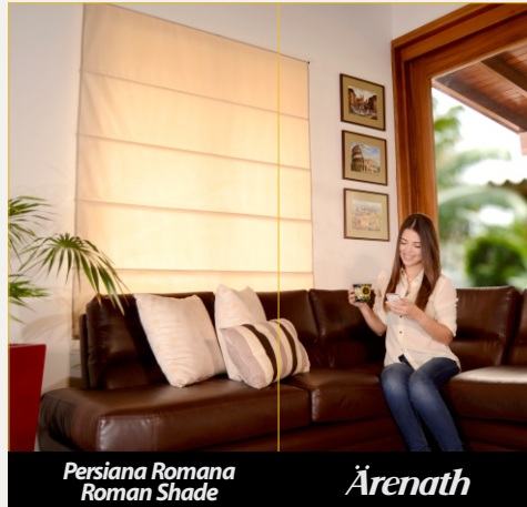
Persiana Romana Roman Shade